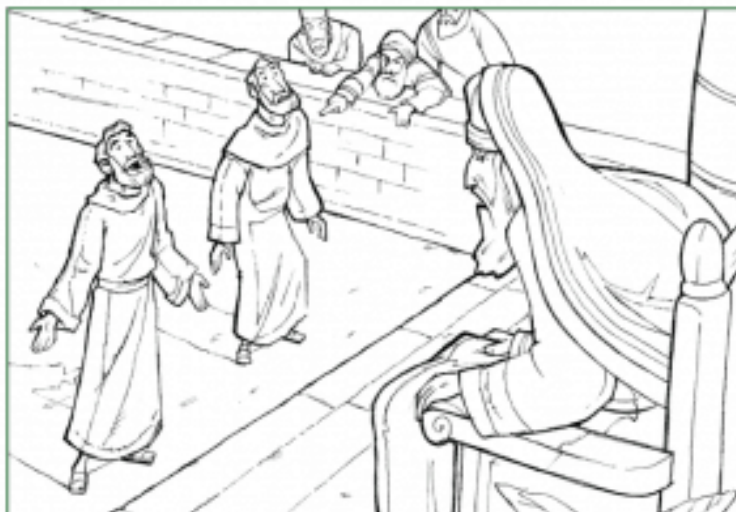
Peter Preached with Boldness